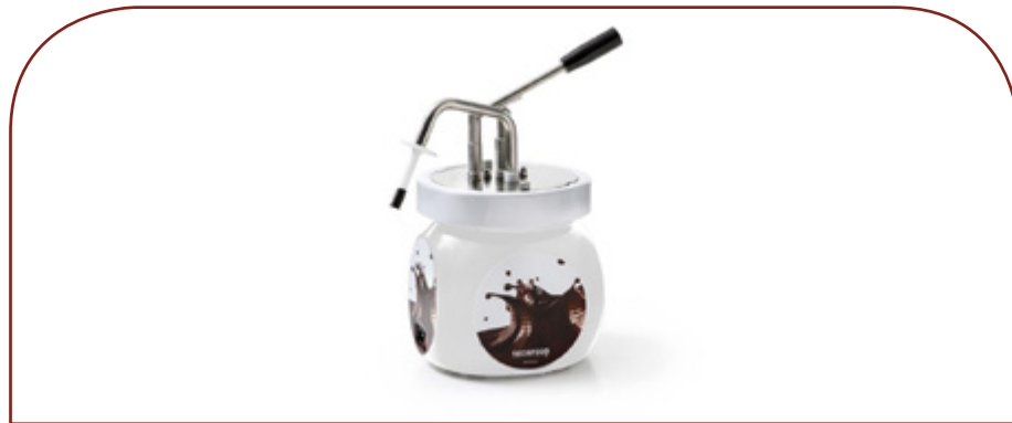
Dispensador de Nutella